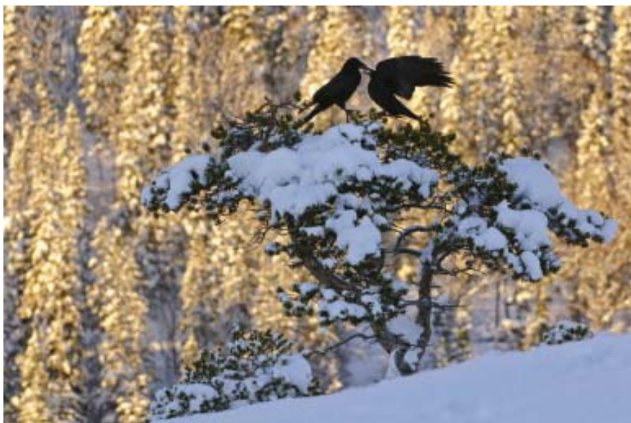
Autorem fotografie s názvem „Tokající krkavci“ je fotograf Willi Rolfes a tato fotografie získala v loňském ročníku 1. místo.

2. Motivy a hodnocení: Povoleny jsou motivy z evropské přírody. Porota udělí 1. až 12. cenu a „zvláštní cenu poroty“. Prvních 12 oceněných snímků bude otištěno v kalendáři EuroNatur 2012. Na výstavu bude vybráno celkem 30 fotografií. Rozhodnutí poroty je konečné. Pořadatelé mají právo vyřadit fotografie, které porušují následující pravidla www.euronatur.org/fotowettbewerb . Přípustné nejsou digitálně upravené snímky, fotografie domácích zvířat, záběry ukazující formy pěstování divokých rostlin a snímky, které nebyly pořízeny v Evropě.