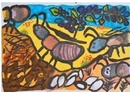
VÍTĚZNÝ OBRÁZEK LOŽSKÉHO ROČNÍKU SOUTĚŽE AUTOR: MARTIN PŘENĚK

Nejlepší dětské tvůrčí budou odměněni na galavečeru NaturVision 20. září 2013. Celkový vítěz obdrží Cenu Stanislavy Chumanové. Z nejlepších prací bude v MěKS Vimperk uspořádána výstava. Těšíme se na zajímavé dětské pohledy do světa zvířat!