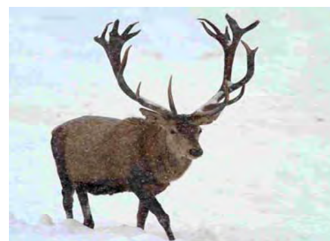
Příchozím doporučujeme si vzít teplé oblečení, dalekohled a určitě nechat doma psa.